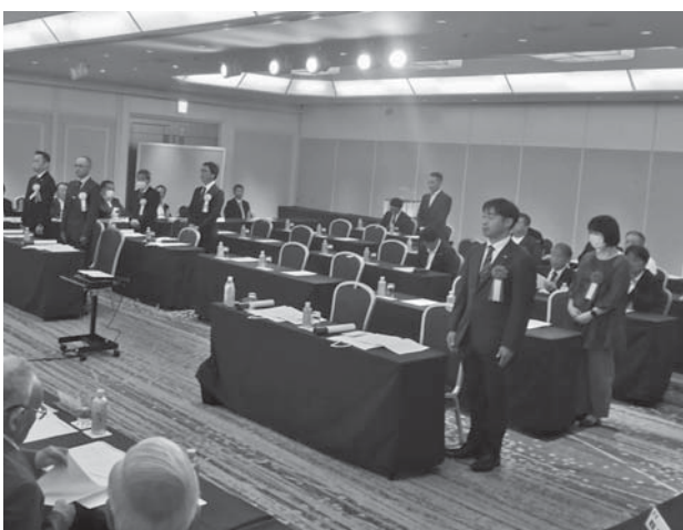
表彰式参列の優秀組合員・優秀従業員の皆様