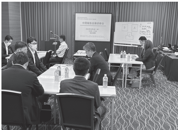
対面参加とオンライン配信（Zoom）で併用開催されました

去る10/4（水）に仙台市内のTKP ガーデンシティ PREMIUM 仙台西口に於いて、「次世代SS経営人材育成研修会」が開催されました。こちらは全石連主催のSS運営の若手経営者、経営幹部を対象とした研修会で宮城県をはじめ、東北各県の組合青年部の皆様が対面参加及びオンライン出席し、公募事業に採択された新事業の報告と外部講師による講演会が行われました。