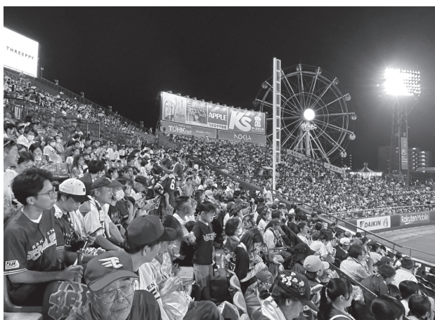
給油所社員招待イベント参加者の皆様

試合は残念ながら1-4の惜敗となりましたが、参加者の方々は、声出しと拍手で応援し、野球観戦を楽しんでおられました。2023年度の給油所社員招待イベントは無事終了いたしました。