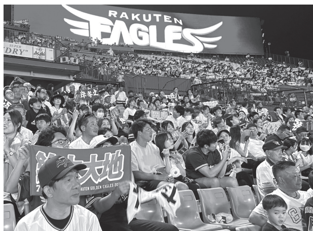
声出しや選手タオルを掲げて応援