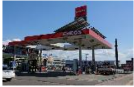
給油取扱所のイメージ