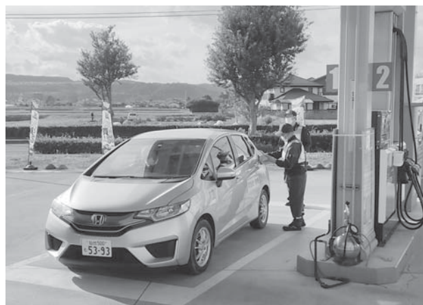
緊急車両への給油訓練を行う参加者の皆様