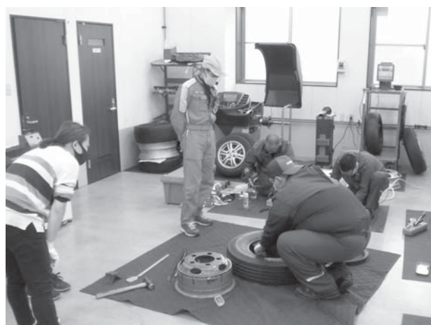
タイヤ交換技能向上研修会の参加者の方々